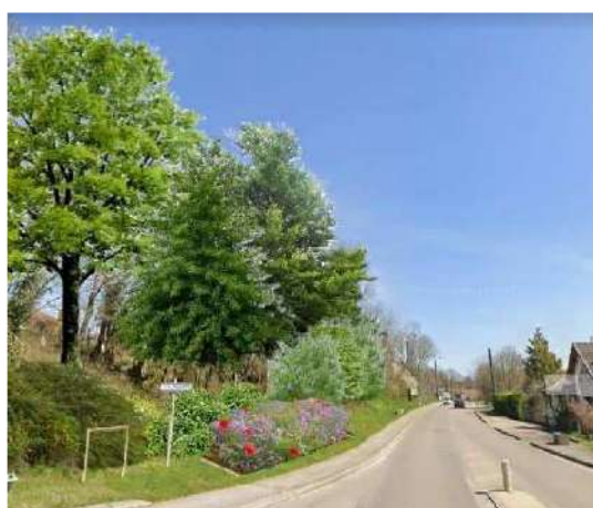
La commission Cadre de Vie

Notre municipalité a à cœur d'améliorer la qualité de vie de tous les habitants. Mais il nous faut trop souvent regretter la perte de certaines valeurs morales et le manque de civisme de certains de nos habitants. Pour autant, notre volonté de construire pour tous un cadre de vie agréable et sécurisant reste entière.